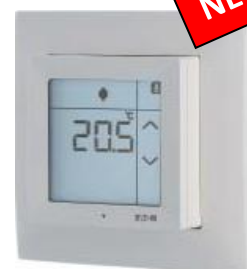
KOMPLET = CPAD-00/198 (187712) Rámeček EATON 55x55 mm, lesklá bílá

Novinkou bezdrátového systému EATON xComfort je RF termostat s dotykovým displejem , vybavený vnitřním senzorem teploty, vlhkosti a intenzity a časovými plány . Proto je ideálním řešením pro regulaci vytápění a chlazení , příp. jen pro monitorování klimatu v místnosti. Termostat má externí vstup PT1000 pro připojení senzoru CSEZ-01/36 pro měření venkovní teploty nebo regulaci elektrického podlahového vytápění s omezením max. podlahové teploty (při přímém řízení rovněž min. teploty podlahy). Termostat trvale zobrazuje teplotu v místnosti a při doteku rovněž vlhkost, čas nebo venkovní teplotu – ovšem pokud systém venkovní teplotu využívá.